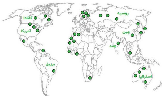
پراکندگی معادن سنگ آهن در جهان